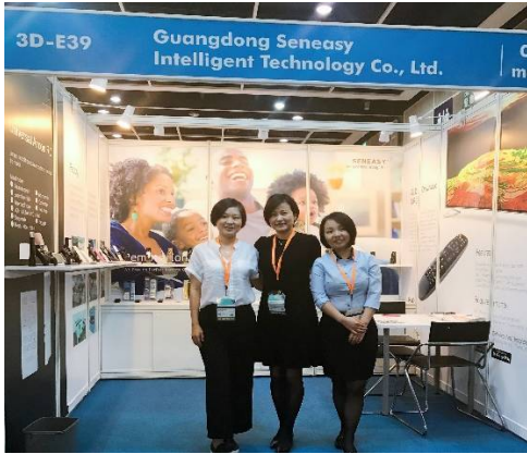
一、2017年4月13日，辰奕智能成功参加香港春季电子展（香港会展中心）。