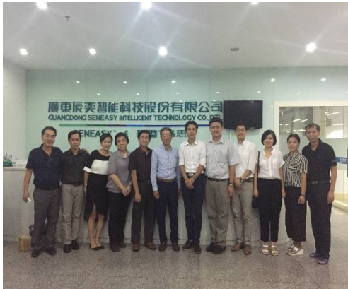
三、2017年1月份，辰奕智能通过日本松下公司的供应商体系审核，成为日本松下智能控制器合格供应商。