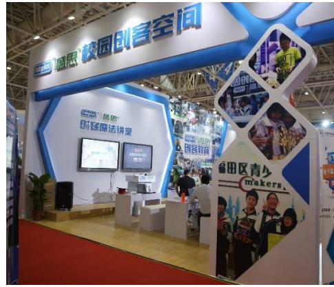
二、2017年5月7日，子公司盛思科教成功参加第72届中国教育装备展（福州市海峡国际会展中心）