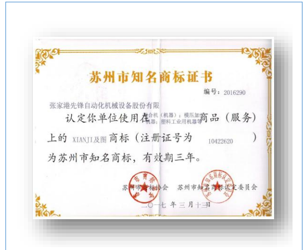
2017年3月，荣获苏州市知名商标证书