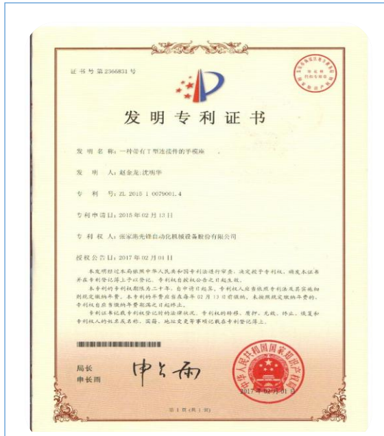
2017年2月1日，一种带有T型连接件的手模座获发明专利