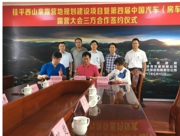
2017 年 6 月 15 日，“西山泉露营地规划建设项目暨第四届中国汽车（房车）露营大会三方签约仪式”在桂平市举行。