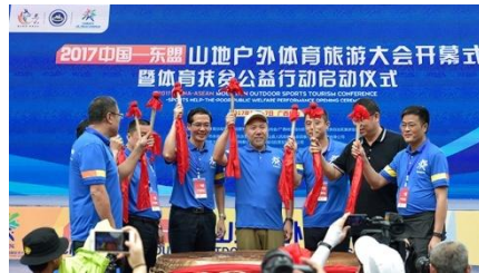
纵情山水，乐动马山！ 2017 年 5 月 6 日上午，中国—东盟山地户外体育旅游大会开幕活动暨体育扶贫公益行动启动仪式在广西马山县三甲屯拉开序幕！