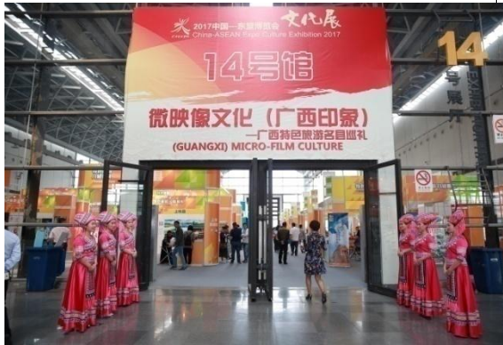
公司承办的 2017 中国—东盟博览会文化展—“映像广西”在南宁国际会展中心开展。