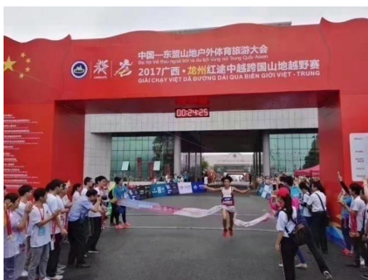
龙州掀起红色旋风，传递中国正能量！2017 年 5 月 20 日上午，2017 龙州红途中越跨国山地越野赛在广西龙州县水口岸拉开帷幕，激情开跑。