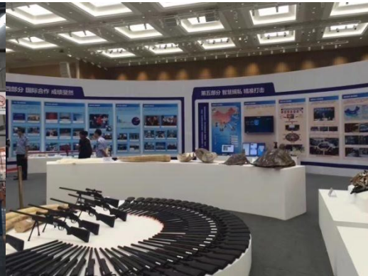
2017 年 6 月，“忠诚的道路 2013-2016 全国打击走私成果展”在南宁国际会展中心举办，该展览在 7 月移师海关总署进行巡回展出。