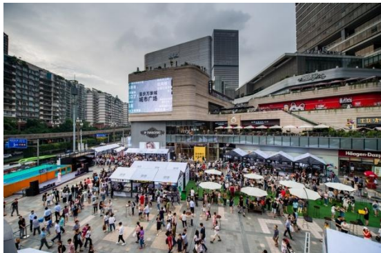
2017 年 5 月起，新影响启动万物好吃环球美食巡展活动，该活动为新影响自营 IP 产品，以米其林餐厅星厨为主体，优选全球特色优质美食餐饮品牌入驻。