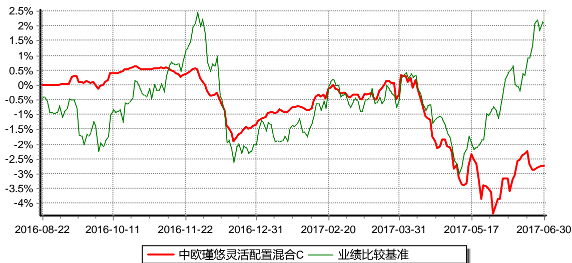
中欧瑾悠灵活配置混合C 份额累计净值增长率与业绩比较基准收益率历史走势对比图 (2016年08月22日-2017年06月30日)

注：本基金基金合同生效日期为2016年8月22日，自基金合同生效日起到本报告期末不满一年，按基金合同的规定，本基金自基金合同生效起六个月为建仓期，建仓期结束时本基金的各项资产配置比例已达到基金合同的规定。