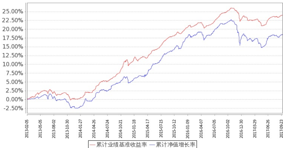
图 2: 嘉实中证中期企业债指数 (LOF) C 基金份额累计净值增长率与同期业绩比较基准收益率的历史走势对比图