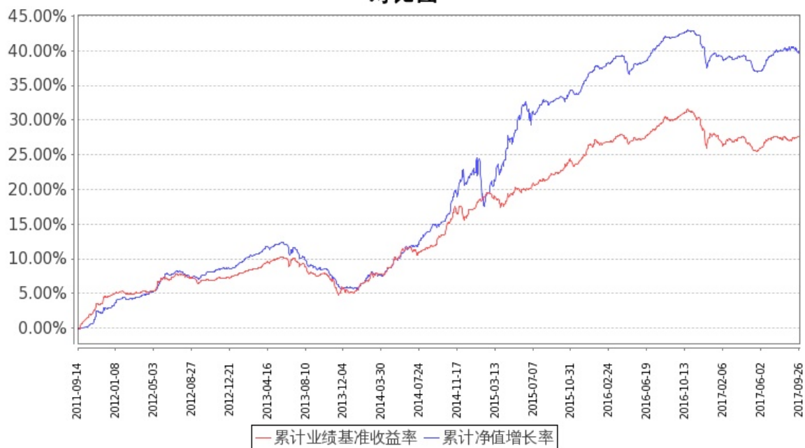
图 1: 嘉实信用债券 A 基金份额累计净值增长率与同期业绩比较基准收益率的历史走势对比图 (2011 年 9 月 14 日至 2017 年 9 月 30 日)