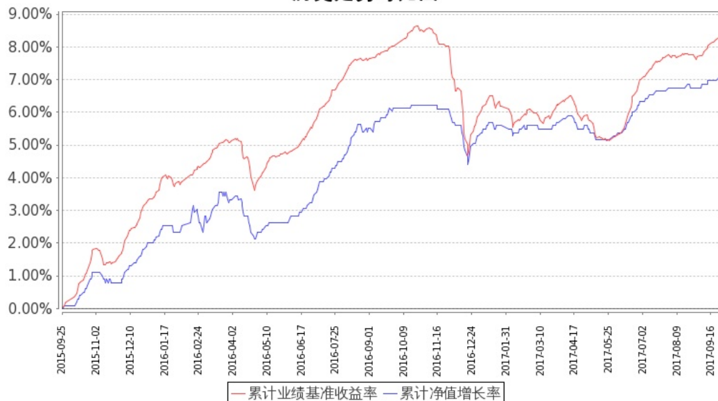
嘉实增强收益定期债券C基金份额累计净值增长率与同期业绩比较基准收益率的历史走势对比图