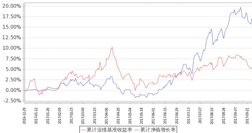
图 2: 嘉实物流产业股票 C 基金累计份额净值增长率与同期业绩比较基准收益率的历史走势对比图