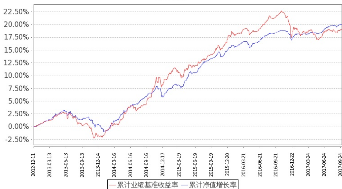
图 1：嘉实纯债债券 A 基金份额累计净值增长率与同期业绩比较基准收益率的历史走势对比图 (2012 年 12 月 11 日至 2017 年 9 月 30 日)