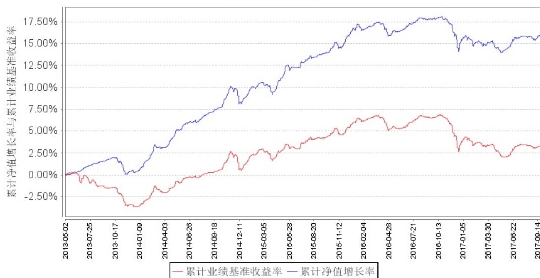
南方中债中期票据指数债券发起A累计净值增长率与同期业绩比较基准收益率的历史走势对比图