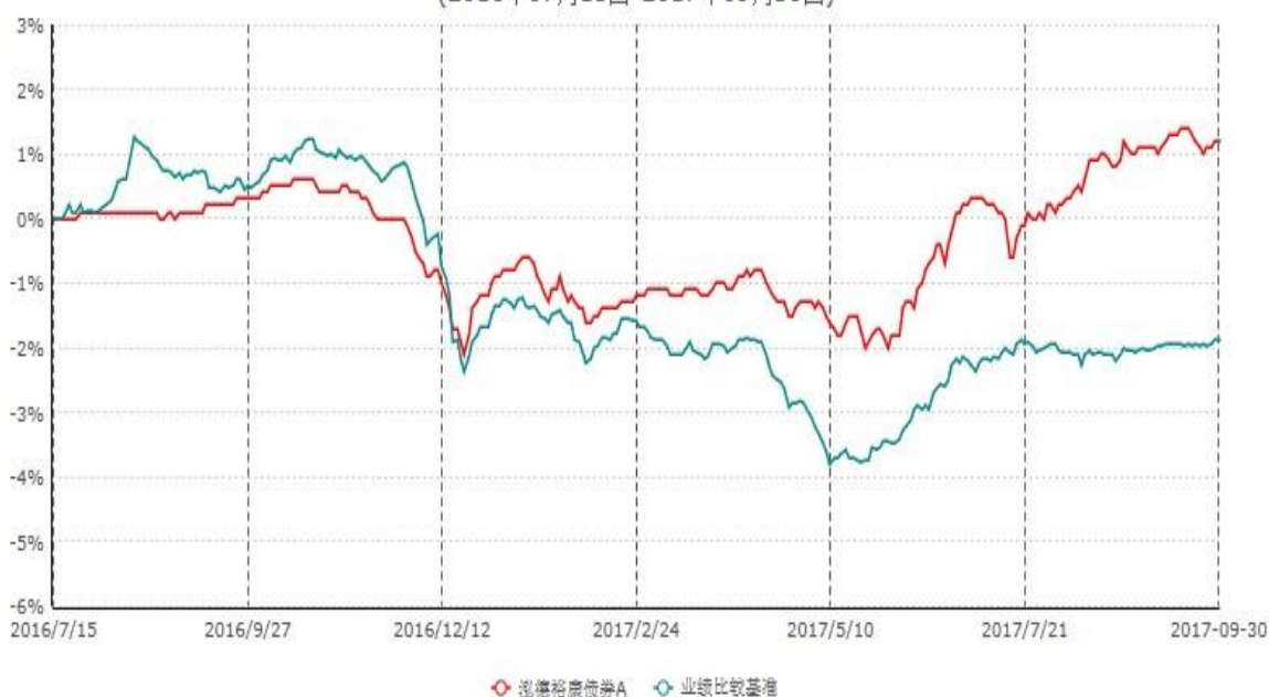
泓德裕康债券A累计净值增长率与业绩比较基准收益率历史走势对比图 (2016年07月15日-2017年09月30日)