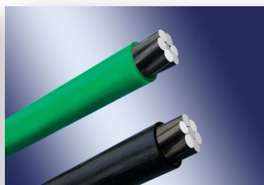
无粘结预应力钢绞线