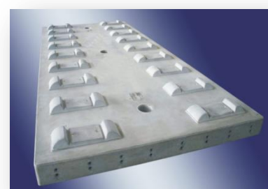
轨道交通无砟轨道板