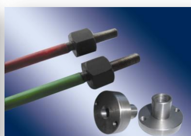
无粘结预应力钢棒