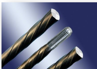
螺旋肋预应力钢丝