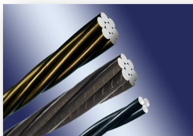
各品种预应力钢绞线