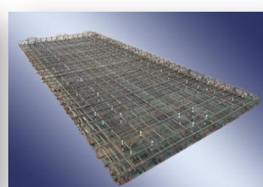
轨道交通轨道板钢材系统