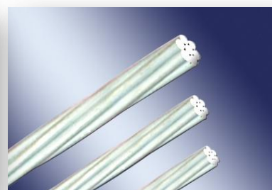
镀锌预应力钢绞线