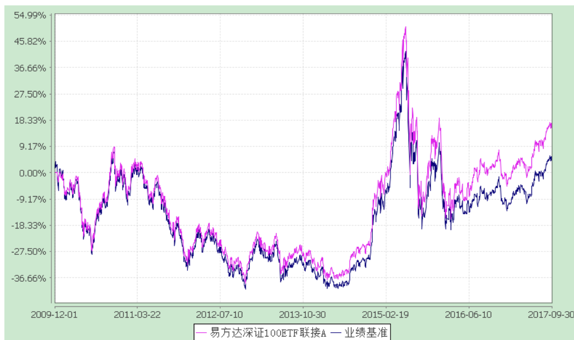
易方达深证 100ETF 联接 C: