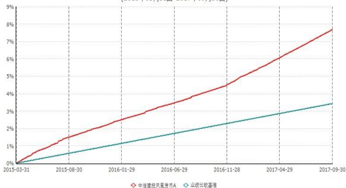
中信建投凤凰货币A累计净值收益率与业绩比较基准收益率历史走势对比图 (2015年03月31日-2017年09月30日)