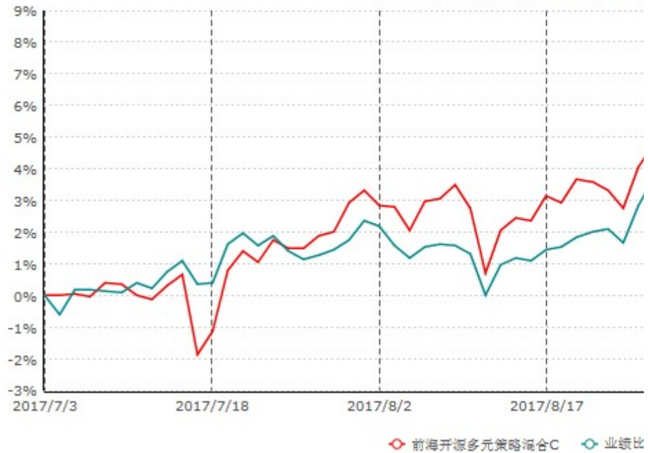
前海开源多元策略混合C累计净值增长率与业绩比较 (2017年07月03日-2017年09月)