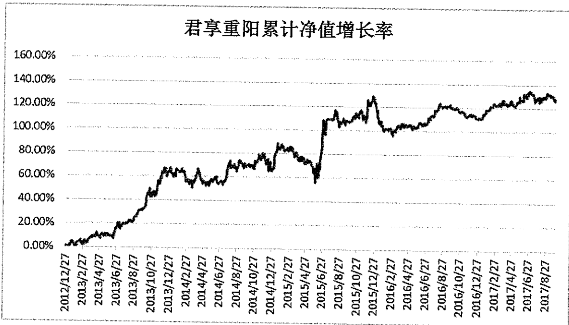
集合计划累计份额净值增长率历史走势图