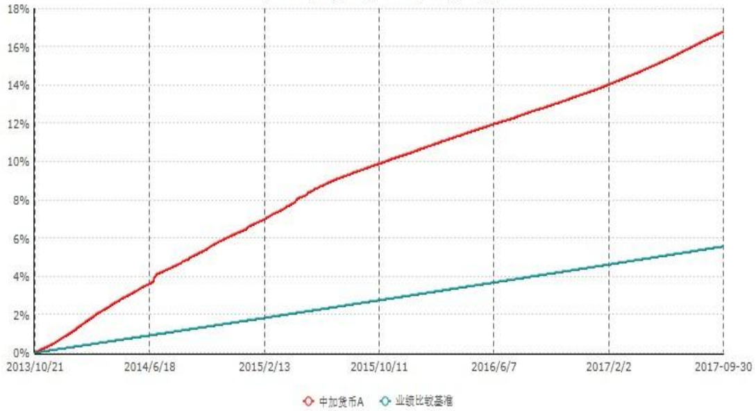
中加货币A累计净值收益率与业绩比较基准收益率历史走势对比图 (2013年10月21日-2017年09月30日)