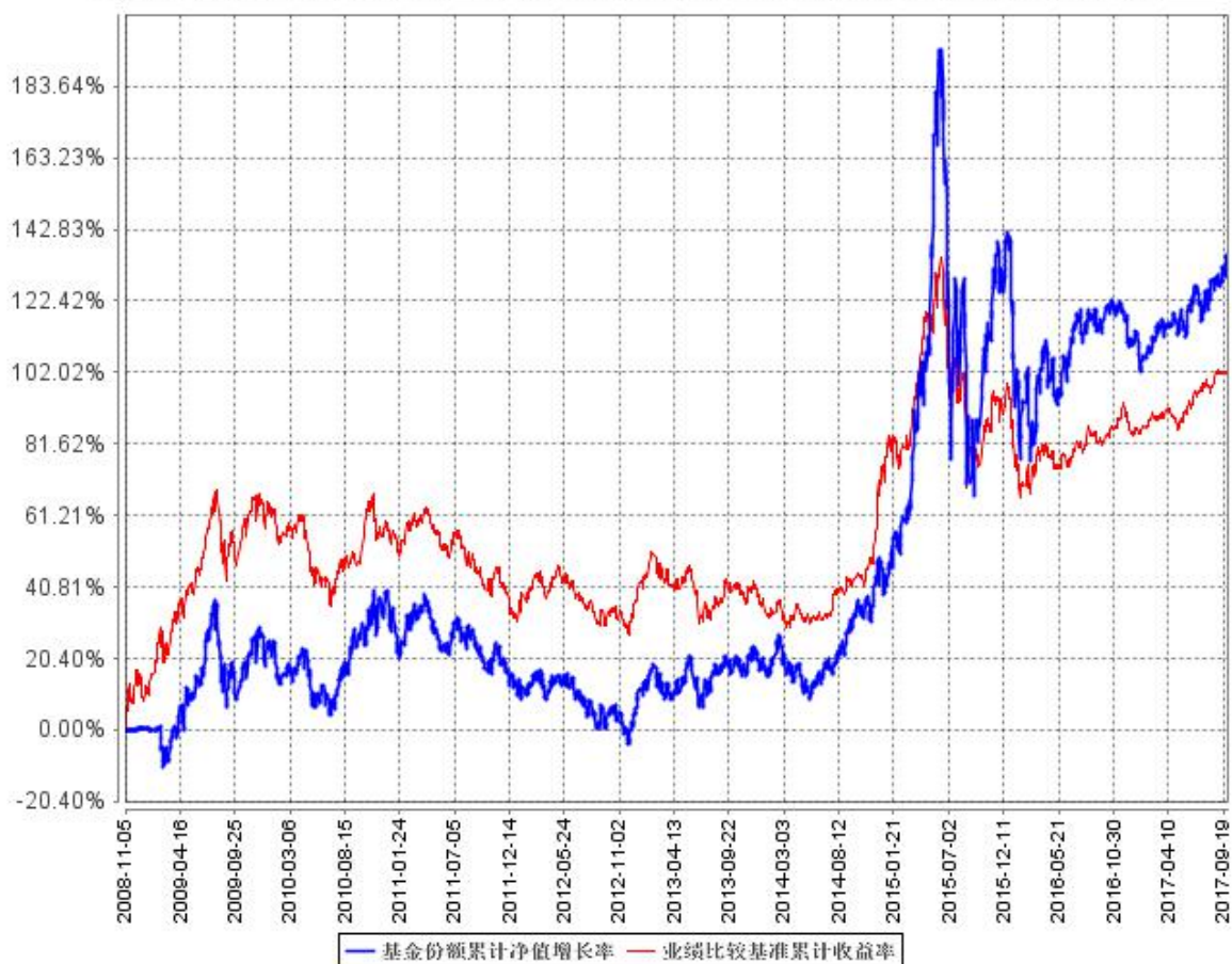
基金份额累计净值增长率与同期业绩比较基准收益率的历史走势对比图

注：本基金成立于 2008 年 11 月 5 日，图示时间段为 2008 年 11 月 5 日至 2017 年 9 月 30 日。