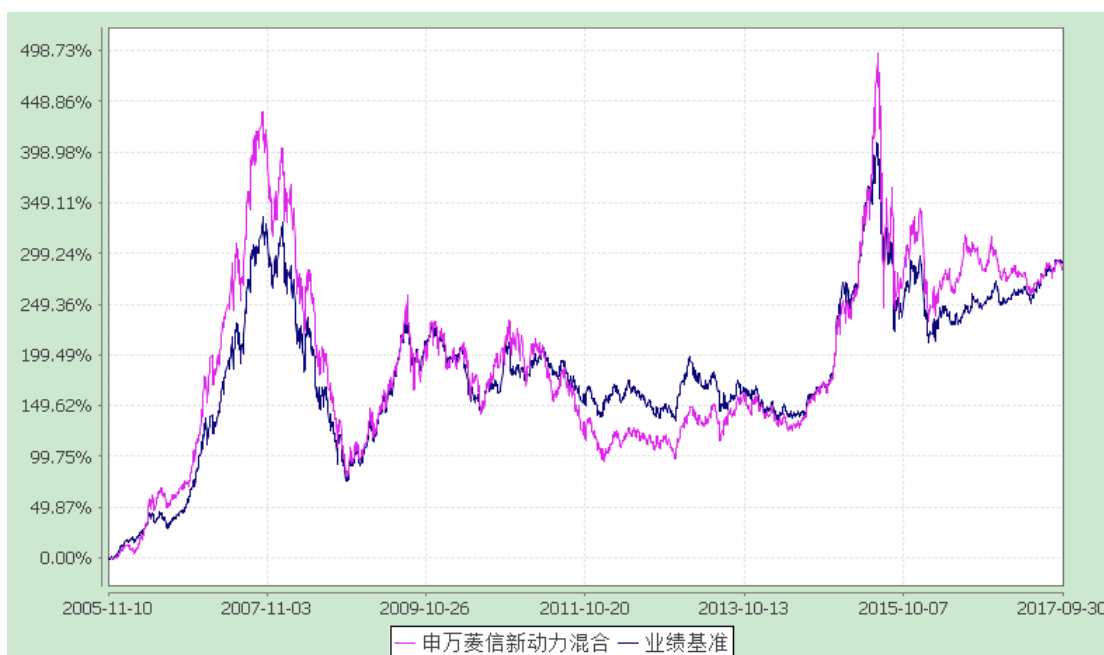
申万菱信新动力混合型证券投资基金 累计净值增长率与业绩比较基准收益率历史走势对比图 (2005年11月10日至2017年9月30日)

2. 自《基金合同》生效以来基金份额累计净值增长率与同期业绩比较基准的变动比较。