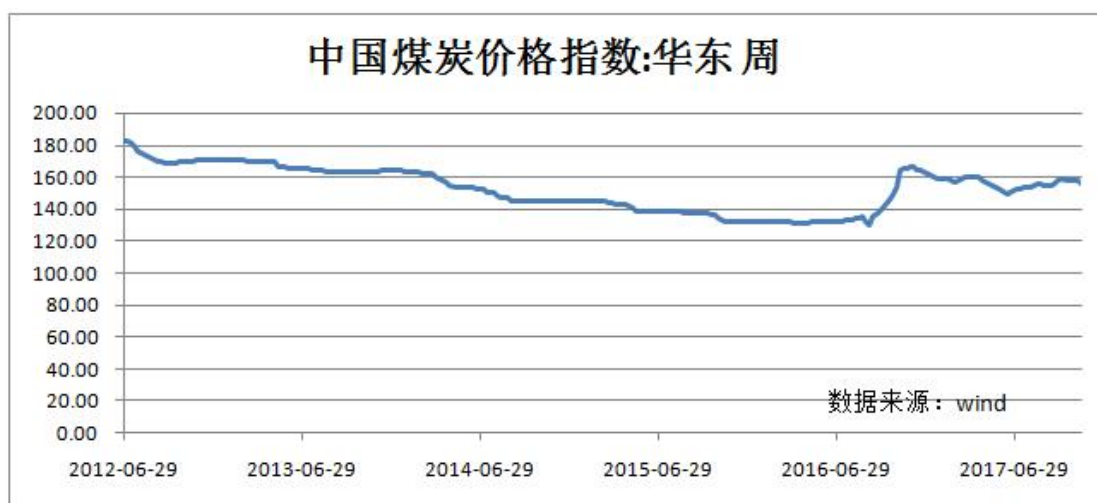
（图2. 中国煤炭价格指数[华东]走势图）

2002 年至 2011 年这十年被视为“煤炭黄金十年”。进入 2012 年，受经济走低以及煤炭自身产能释放和外煤不断涌入的影响，全国煤炭市场发生了重大变化，煤炭行业黄金十年遭遇了拐点。根据中国煤炭价格指数（华东），从 2012 年 6 月的 182.50 到 2016 年 9 月跌至近年最低 130.2（见下图），2016 年 10 月至 2016 年 12 月煤炭价格急剧攀升，至 2016 年 12 月升至近两年最大值 164.7，2017 年 1 月至今煤炭指数价格处于近年高位波动。