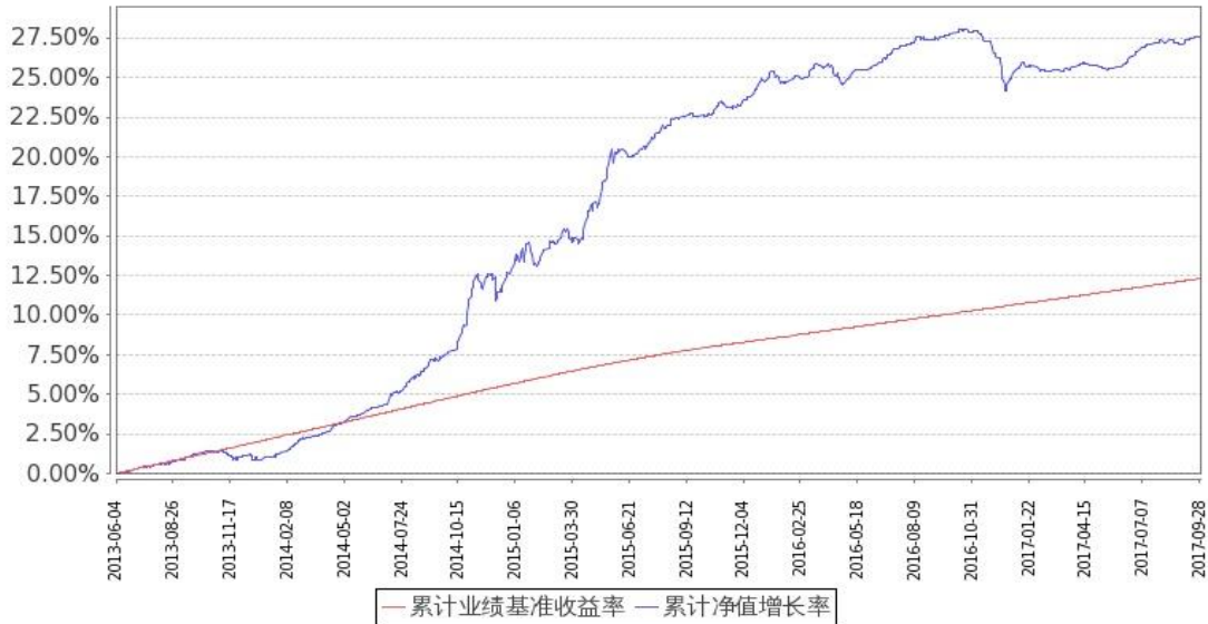
图 1：嘉实如意宝定期债券 A/B 基金份额累计净值增长率与同期业绩比较基准收益率的历史走势对比图