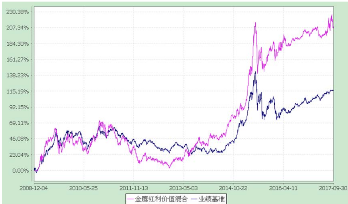
金鹰红利价值灵活配置混合型证券投资基金 累计净值增长率与业绩比较基准收益率历史走势对比图 (2008 年 12 月 4 日至 2017 年 9 月 30 日)

注：(1) 截至报告日本基金的各项投资比例已达到基金合同规定的各项比例；(2) 本基金的业绩比较基准为：中证红利指数收益率×60%+上证国债指数收益率×40%。