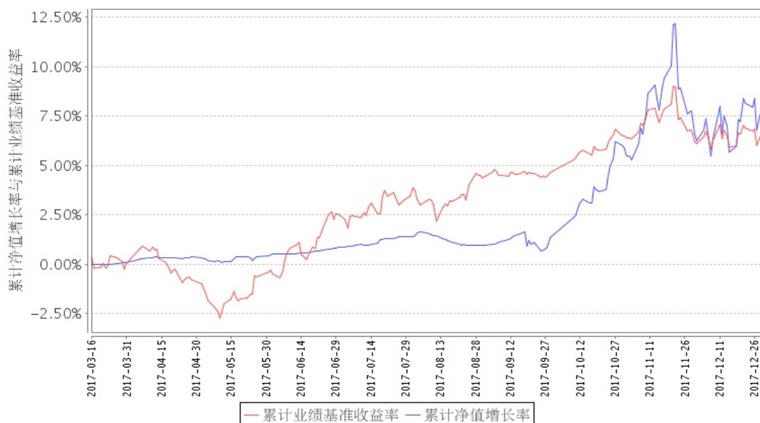
安信新起点混合A累计净值增长率与同期业绩比较基准收益率的历史走势对比图