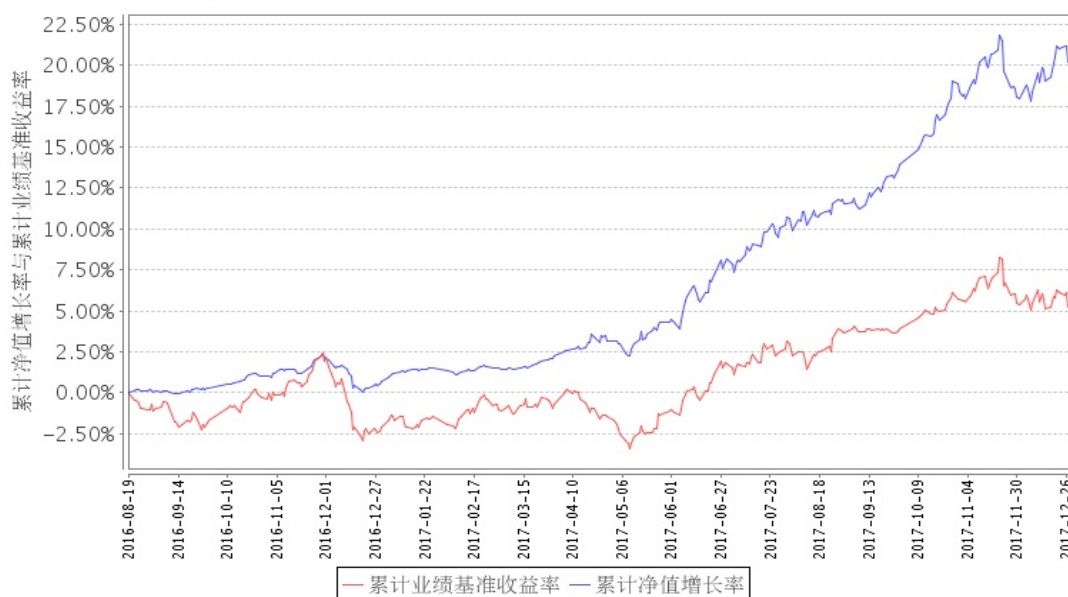
安信新价值混合A累计净值增长率与同期业绩比较基准收益率的历史走势对比图