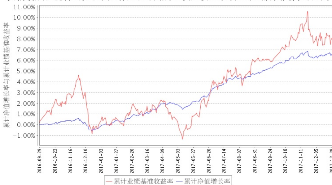
安信新成长混合A累计净值增长率与同期业绩比较基准收益率的历史走势对比图