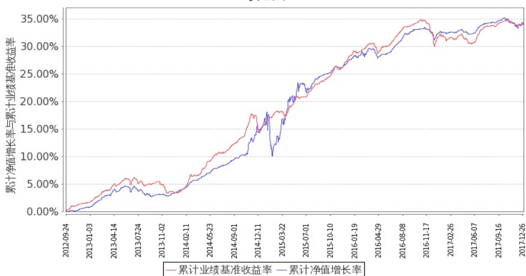
图 1：嘉实增强收益定期债券 A 基金份额累计净值增长率与同期业绩比较基准收益率的