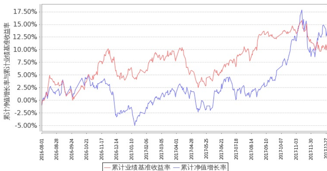
图 2：嘉实成长收益混合 H 基金份额累计净值增长率与同期业绩比较基准收益率的历史走势对比图（2016 年 8 月 1 日至 2017 年 12 月 31 日）

注：按基金合同规定，本基金自基金合同生效日起 6 个月内为建仓期。建仓期结束时本基金的各项投资比例符合基金合同第十八条（二）投资范围和（六）投资组合比例限制）的约定：