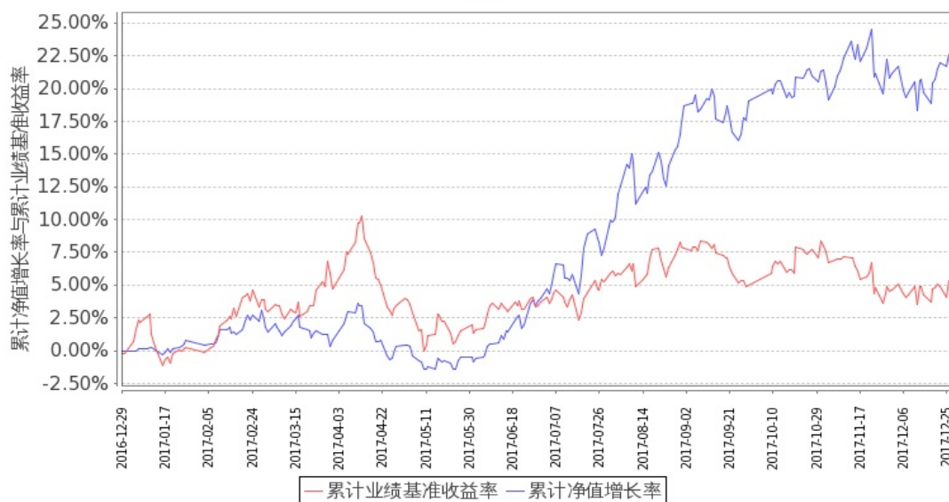
图 1：嘉实物流产业股票 A 基金累计份额净值增长率与同期业绩比较基准收益率的历史走势对比图