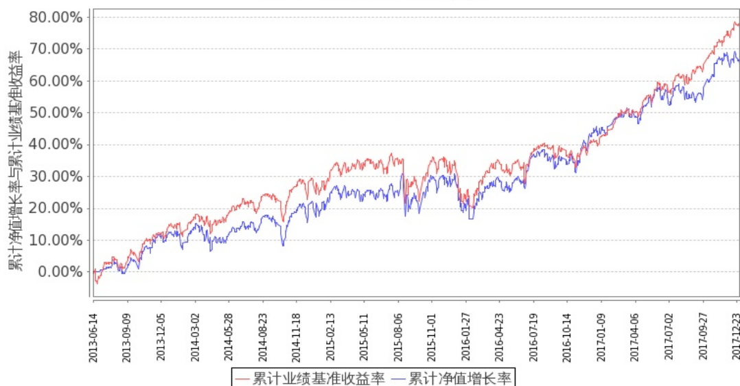
图 1：嘉实美国成长股票型证券投资基金-人民币基金份额累计净值增长率与同期业绩比较基准收益率的历史走势对比图

嘉实美国成长股票型证券投资基金-人民币累计净值增长率与同期业绩比较基准收益率的历史走势对比图