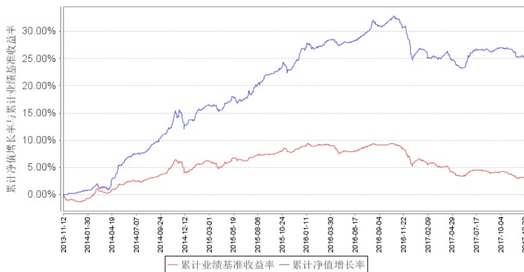
南方丰元信用增强债券A累计净值增长率与同期业绩比较基准收益率的历史走势对比图