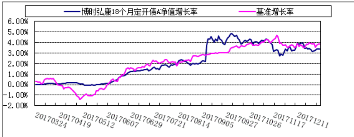
2. 博时弘康18个月定开债C: