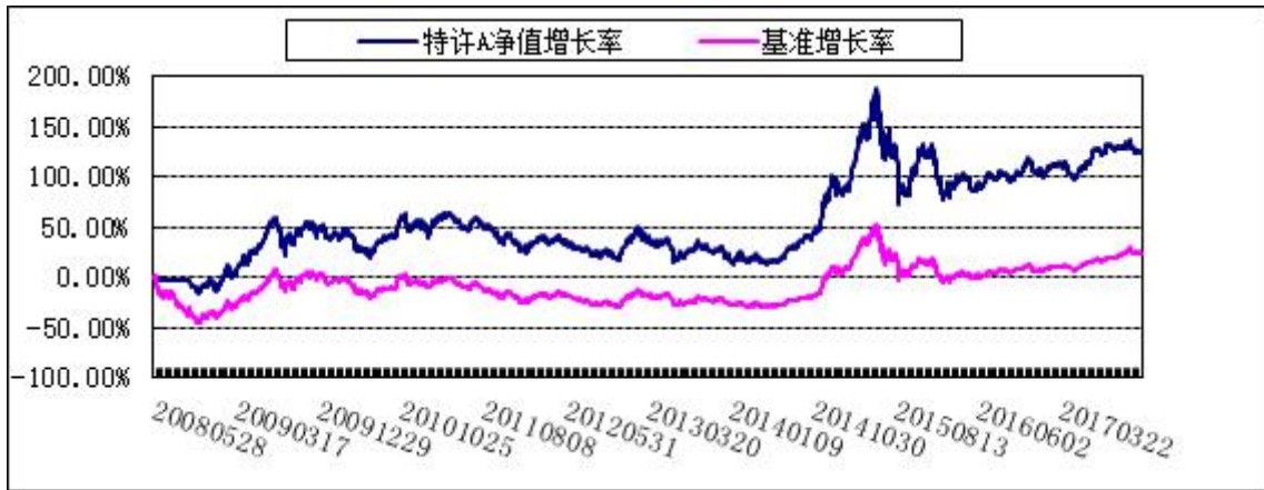
2. 博时特许价值混合R: