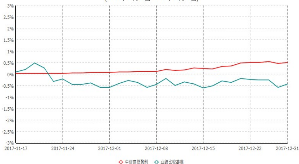
中信建投聚利混合型证券投资基金累计净值增长率与业绩比较基准收益率历史走势对比图 (2017年11月17日-2017年12月31日)

注：1、本基金由中信建投稳利保本2号混合型证券投资基金转型而来并于2017年11月17日合同生效，上图报告期间的起始日为2017年11月17日。截止本报告期末本基金合同生效未满一个季度。