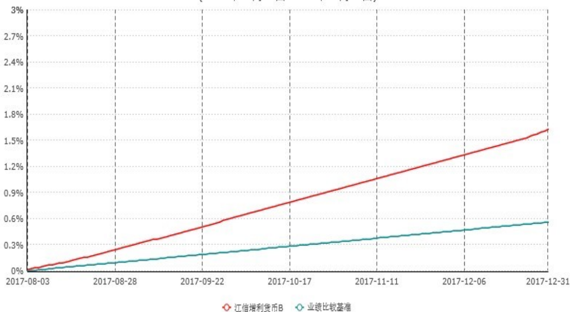
江信增利货币B累计净值收益率与业绩比较基准收益率历史走势对比图 (2017年08月03日-2017年12月31日)