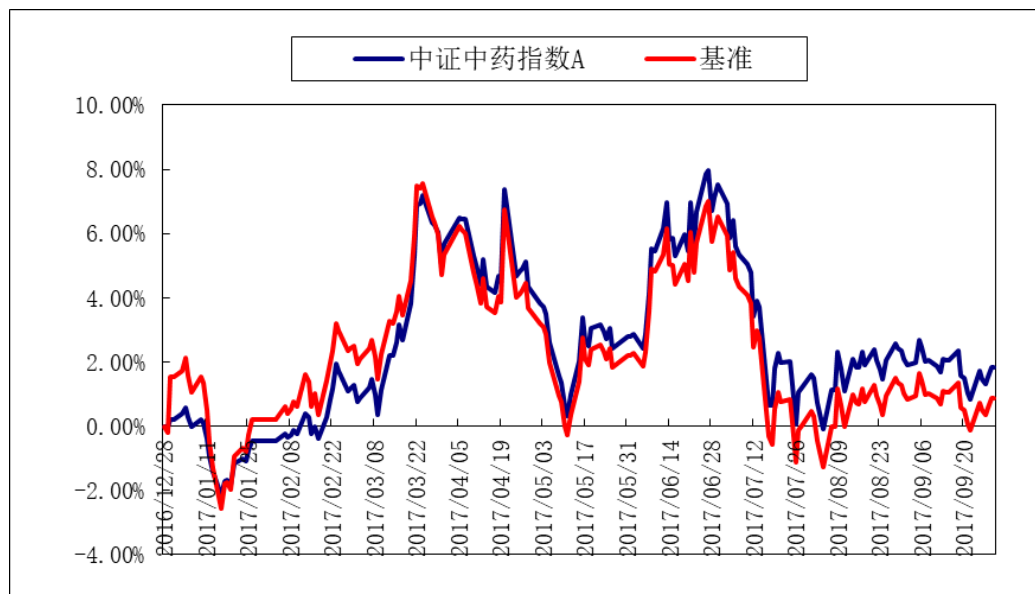
汇添富中证中药指数 C: