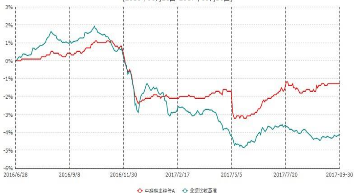
中融融丰纯债A累计净值增长率与业绩比较基准收益率历史走势对比图 (2016年06月28日-2017年09月30日)