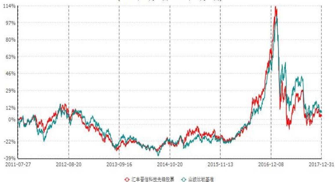
汇丰晋信科技先锋股票型证券投资基金累计净值增长率与业绩比较基准收益率历史走势对比图 (2011年07月27日-2017年12月31日)