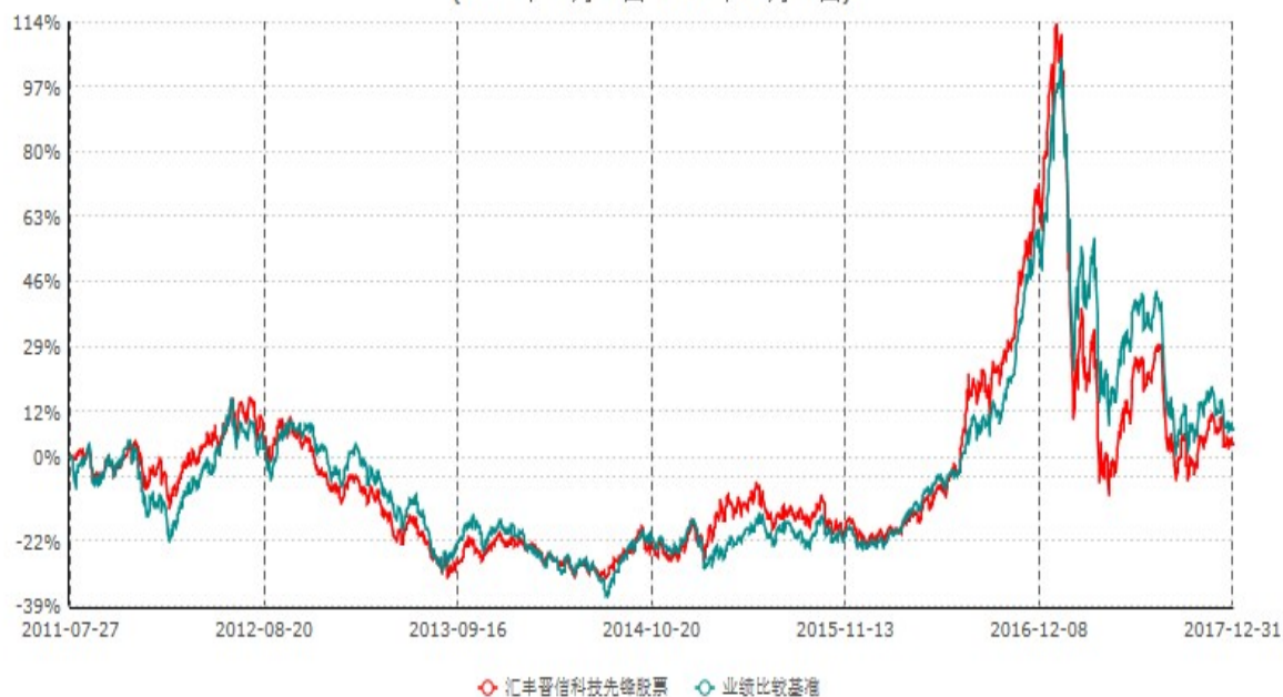
汇丰晋信科技先锋股票型证券投资基金累计净值增长率与业绩比较基准收益率历史走势对比图 (2011年07月27日-2017年12月31日)