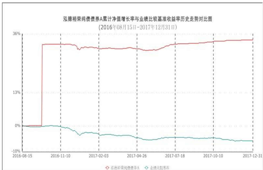
累计净值增长率与业绩比较基准收益率的历史走势对比图