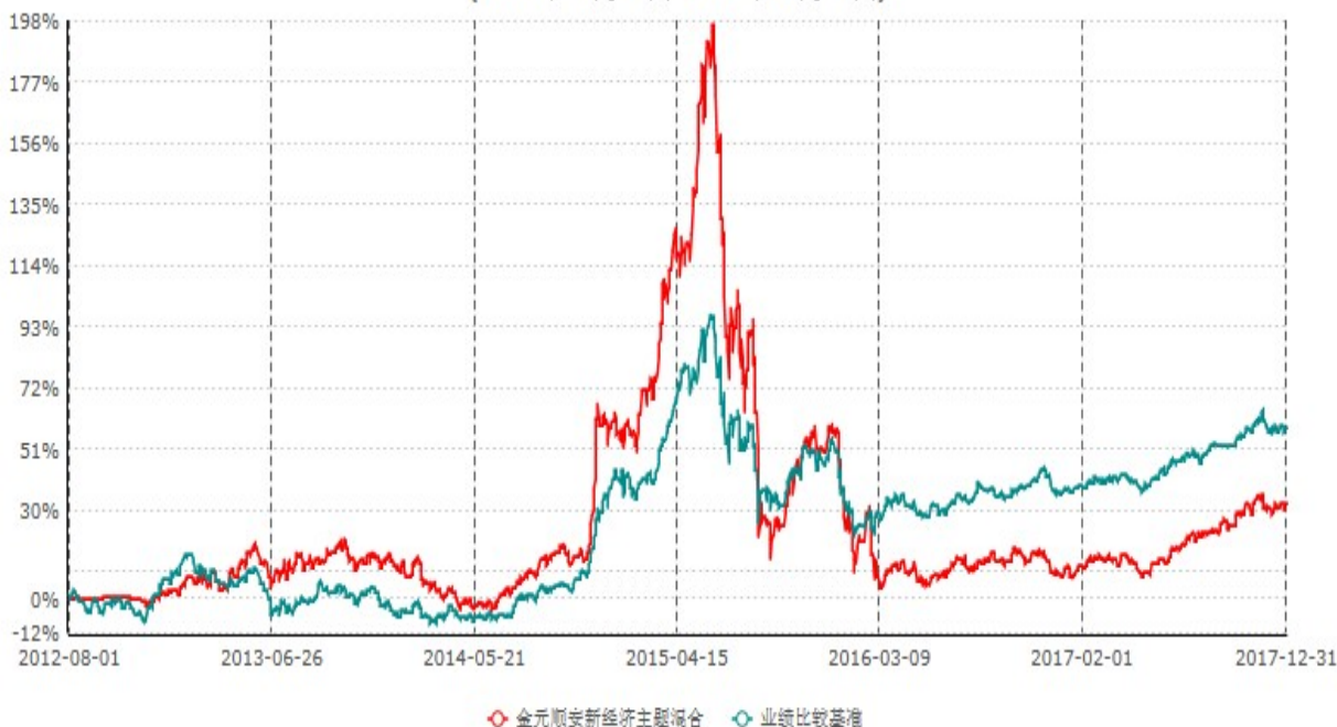
金元顺安新经济主题混合型证券投资基金累计净值增长率与业绩比较基准收益率历史走势对比图 (2012年07月31日-2017年12月31日)