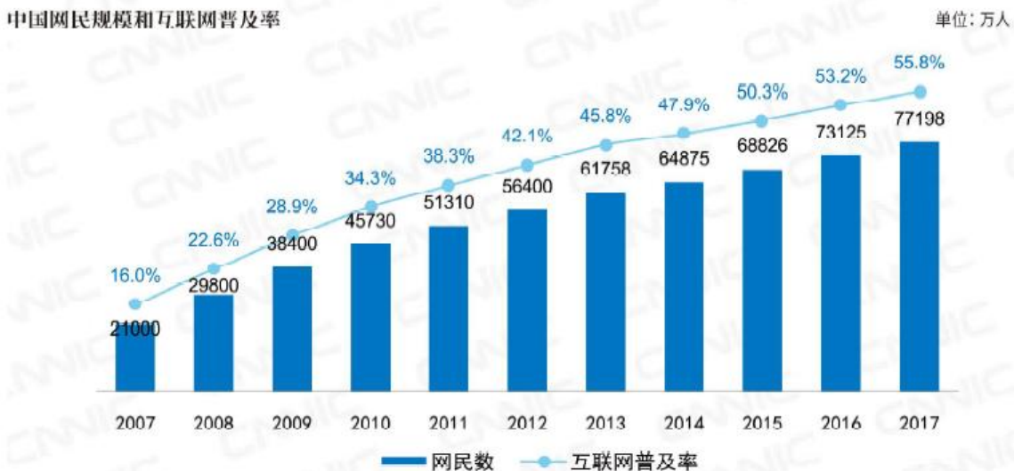
中国网民规模和互联网普及率

根据中国互联网络信息中心（CNNIC）发布的《第41次中国互联网络发展状况统计报告》显示，截至2017年12月底，我国网民规模达7.72亿，普及率达到55.8%，手机网民规模达7.53亿，网民中使用手机上网人群的占比由2016年的95.1%提升至97.5%。我国购买互联网理财的网民规模达到1.29亿，同比增长30.2%。