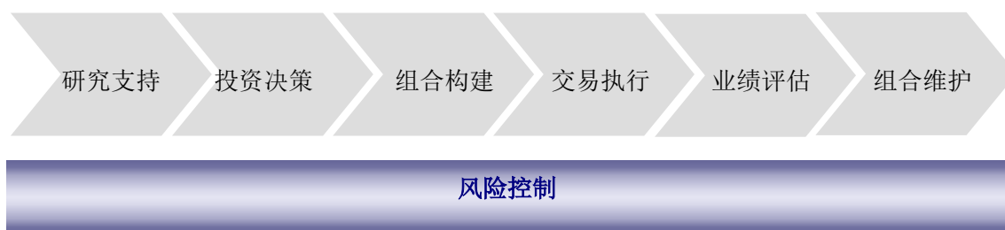
图 2：中银价值精选灵活配置基金投资流程