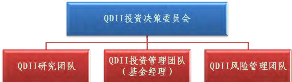
图 2：QDII 投资决策机制和投资管理流程

在投资过程中，QDII 投资决策委员会、QDII 基金经理和投资队伍各职能小组的工作关系参见图 2：