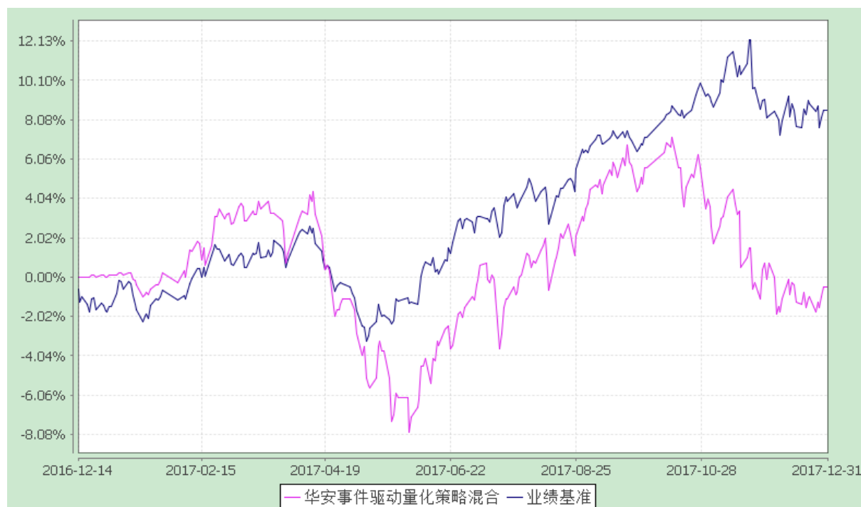
华安事件驱动量化策略混合型证券投资基金 份额累计净值增长率与业绩比较基准收益率的历史走势对比图 (2016 年 12 月 14 日至 2017 年 12 月 31 日)