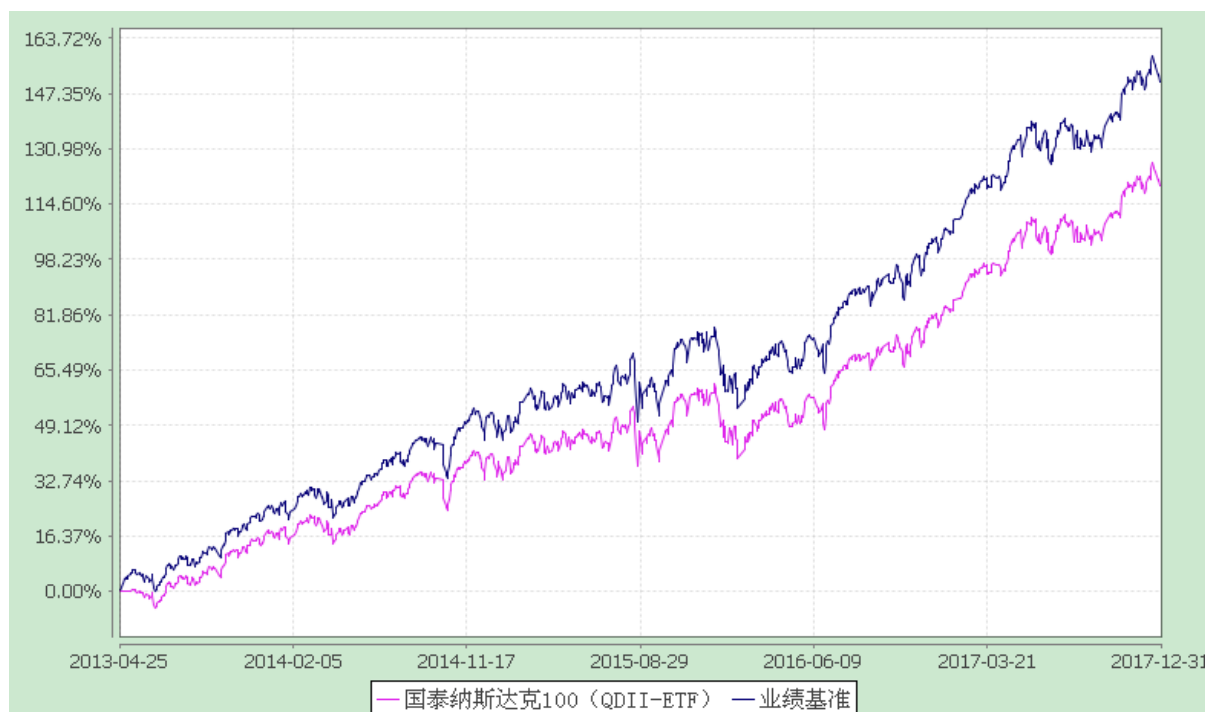
纳斯达克 100 交易型开放式指数证券投资基金 自基金合同生效以来份额累计净值增长率与业绩比较基准收益率历史走势对比图 (2013 年 4 月 25 日至 2017 年 12 月 31 日)

注：（1）本基金合同生效日为 2013 年 4 月 25 日。本基金在 3 个月建仓期结束时，各项资产配置比例符合合同约定。