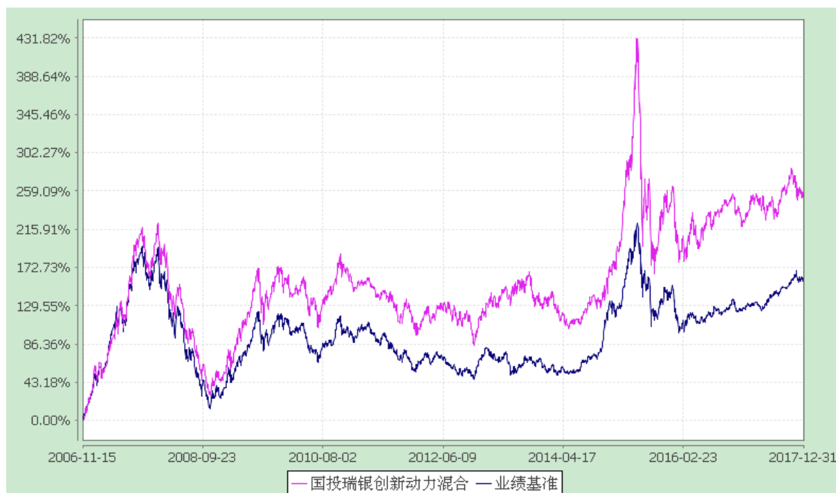
国投瑞银创新动力混合型证券投资基金 份额累计净值增长率与业绩比较基准收益率的历史走势对比图 (2006 年 11 月 15 日至 2017 年 12 月 31 日)

注：本基金建仓期为自基金合同生效日起的六个月。截至建仓期结束，本基金各项资产配置比例符合基金合同及招募说明书有关投资比例的约定。