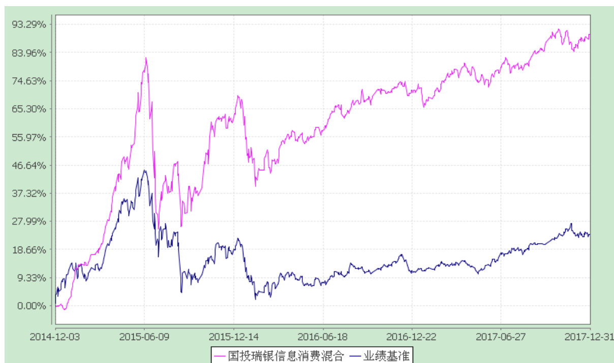
国投瑞银信息消费灵活配置混合型证券投资基金 份额累计净值增长率与业绩比较基准收益率的历史走势对比图 (2014 年 12 月 3 日至 2017 年 12 月 31 日)