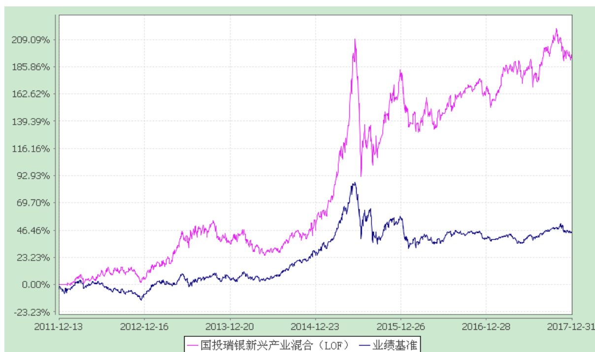
国投瑞银新兴产业混合型证券投资基金(LOF) 份额累计净值增长率与业绩比较基准收益率的历史走势对比图 (2011年12月13日至2017年12月31日)

注：本基金建仓期为自基金合同生效日起的6个月。截至建仓期结束，本基金各项资产配置比例符合基金合同及招募说明书有关投资比例的约定。