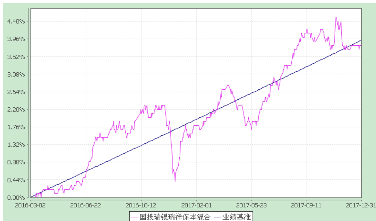
份额累计净值增长率与业绩比较基准收益率的历史走势对比图 (2016 年 3 月 2 日至 2017 年 12 月 31 日)

注：本基金建仓期为自基金合同生效日起的六个月。截至建仓期结束，本基金各项资产配置比例符合基金合同及招募说明书有关投资比例的约定。