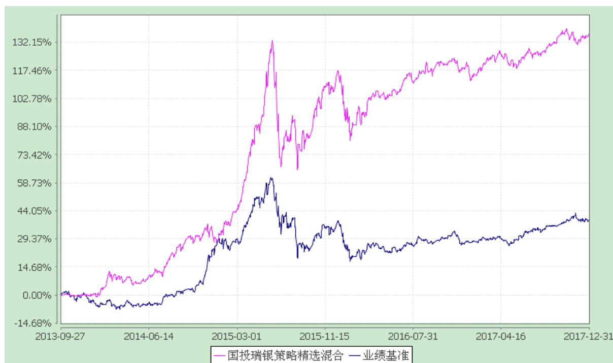
国投瑞银策略精选灵活配置混合型证券投资基金 份额累计净值增长率与业绩比较基准收益率的历史走势对比图 (2013 年 9 月 27 日至 2017 年 12 月 31 日)

注：本基金建仓期为自基金合同生效日起的 6 个月。截至建仓期结束，本基金各项资产配置比例符合基金合同及招募说明书有关投资比例的约定。